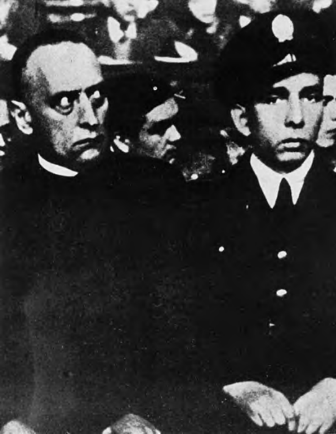
Il card. Joseph Mindszenty al processo farsa.