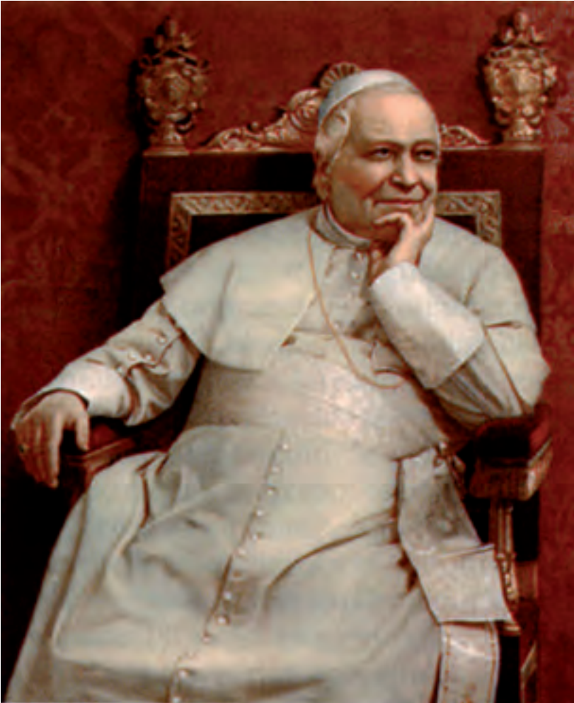
Pio IX, l'ultimo Papa-Re.