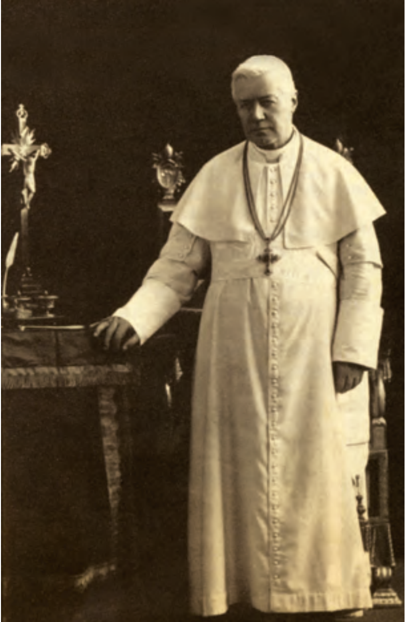
Papa San Pio X.