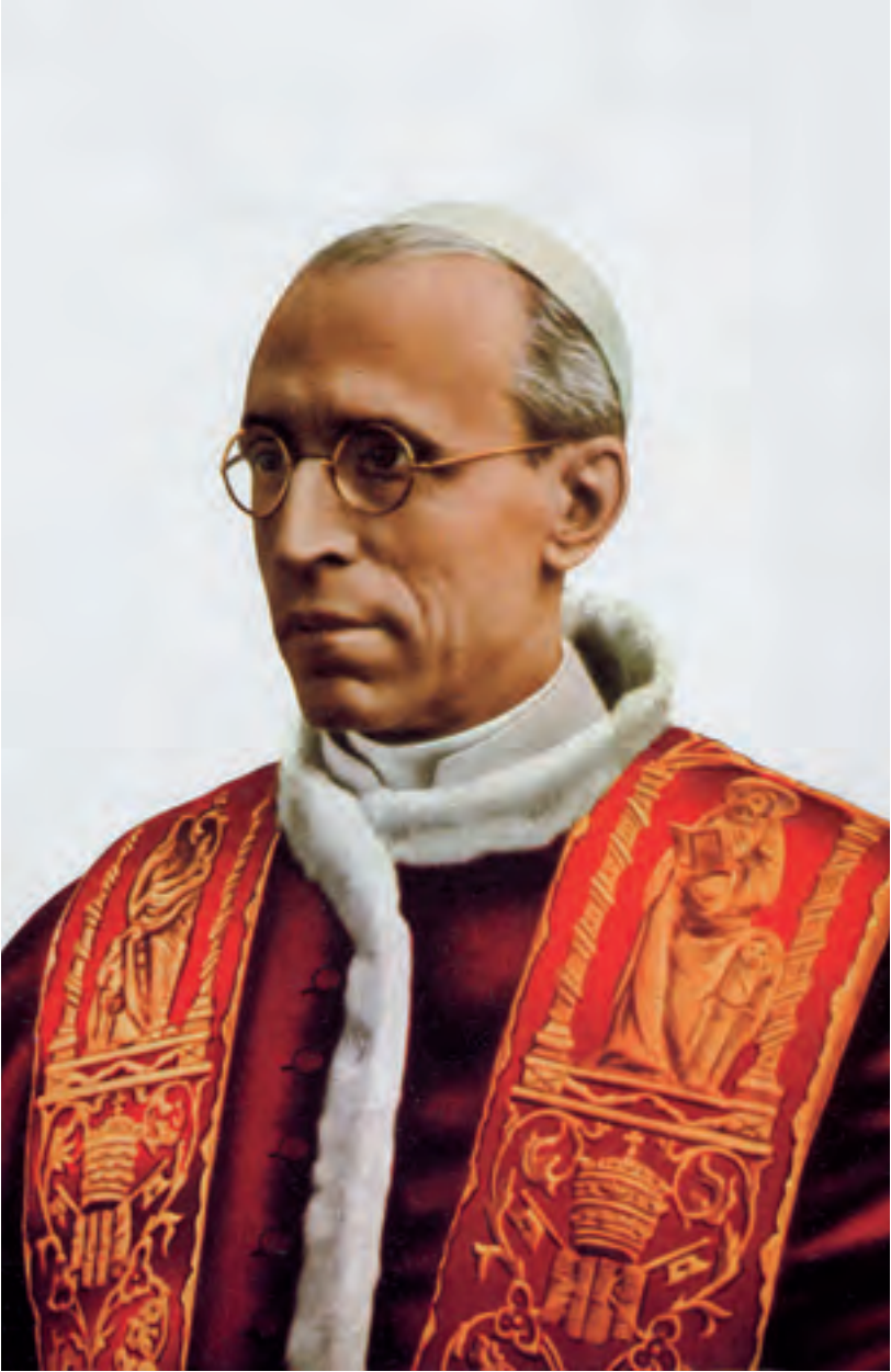
Papa Pio XII.