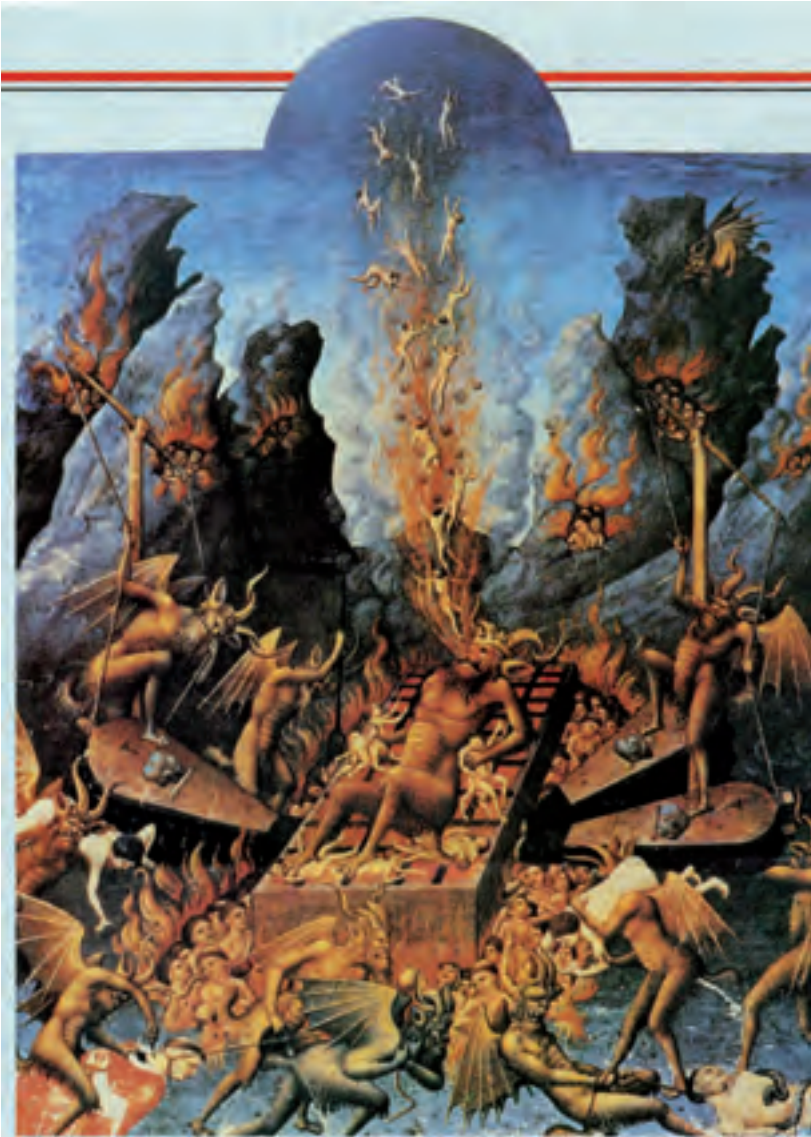
L'Inferno. Miniatura di Jean de Limbourg - sec. XV.